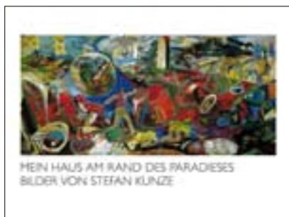
978-3-88190-525-1, 15x20,4 cm, 10 Euro