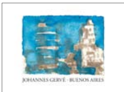
978-3-88190-519-0, 15x20,4 cm, 10 Euro