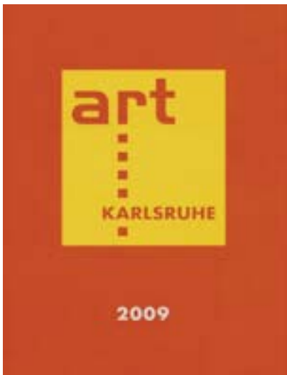
art KARLSRUHE 2009, 978-3-937295-86-5, 15 Euro