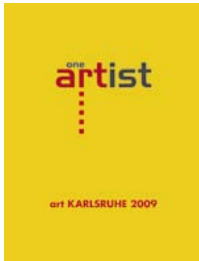
one artist 2009, 978-3-88190-536-7, 10 Euro